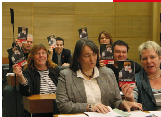
Zeigt Alternativen auf: Die Linksfraktion präsentiert ihren eigenen Haushaltsentwurf

Damit hat allein die Linksfraktion einen sozialen und schuldenfreien Haushaltsentwurf vorgelegt. In heftiges Fahrwasser ist dagegen die SPD geraten: So hatte sie vor wenigen Monaten gemeinsam mit der grünen Fraktion eine Klage vor dem Staatsgerichtshof eingereicht, weil sie den schwarz-gelben Haushalt 2010 wegen Überschuldung für verfassungswidrig hält. Ihr eigener Haushaltsentwurf für 2011 sieht dagegen eine noch höhere Verschuldung vor als derjenige der Landesregierung.