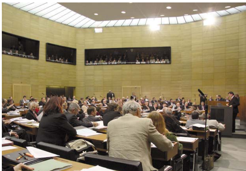
Das Landtagsplenum bei der Arbeit – im Vordergrund DIE LINKE.

Was aber ist die Alternative zu diesem Haushalt der Ignoranz? - Der Ausgangspunkt ist, zunächst einmal die Politik der Schuldzuweisungen zu stoppen. Ihre Politik [...] besteht in erster Linie darin, bei der Frage, wer an der Krise schuld ist, mit dem Finger auf die USA zu zeigen. [...] Sie sollten sich der biblischen Weisheit erinnern: